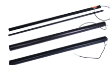
Sensores ASO Edge

SlideSmart CNX y SwingSmart CNX requieren instalación profesional