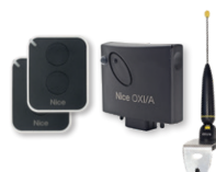
Kit de control remoto CNX