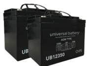
Kit de batería de reserva - 35Ah